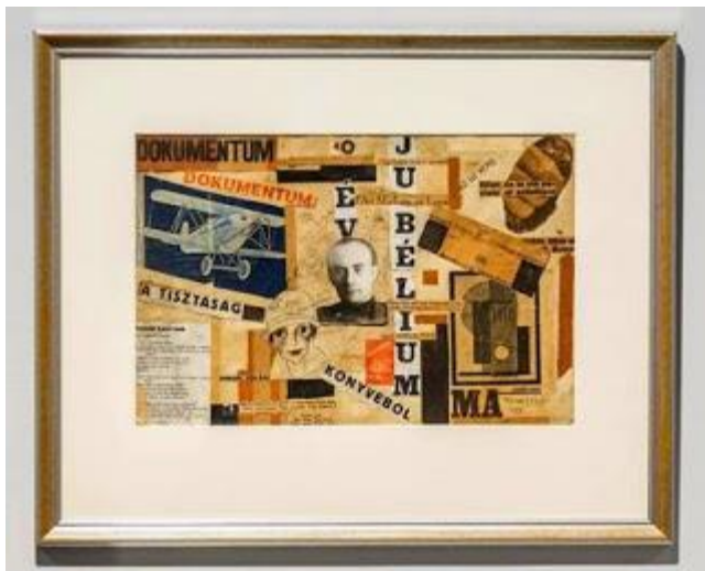
Kassák: Kollázs 1927.

Az első szekció ( Úr ír / kutya ugat / kakas kukorékol Dadaista jelenségek a Kassák-kör művészeti tevékenységében a bécsi emigráció éveiben ) Bortnyik Sándor Zöld szamarával és tusrajzaival indít, majd Kassák Lajos, Moholy-Nagy László, Tihanyi Lajos, Uitz Béla és Bernáth Aurél műveivel folytatja a korszak bemutatását. Bár az 1910-es években nem beszélhetünk magyar dadáról, és a hazai szürrealizmus nagy korszaka is csak az 1940-ben kezdődött, Kassáknál és a magyar avantgárd alkotóinál már az 1920-as években megfigyelhetők az új alkotói módszerek, műfajok, a fotómontázs, a kollázs, a nyomtatott feliratok absztrakt képi jelként való felhasználása. Ezeket a kiállítás dokumentálja is.