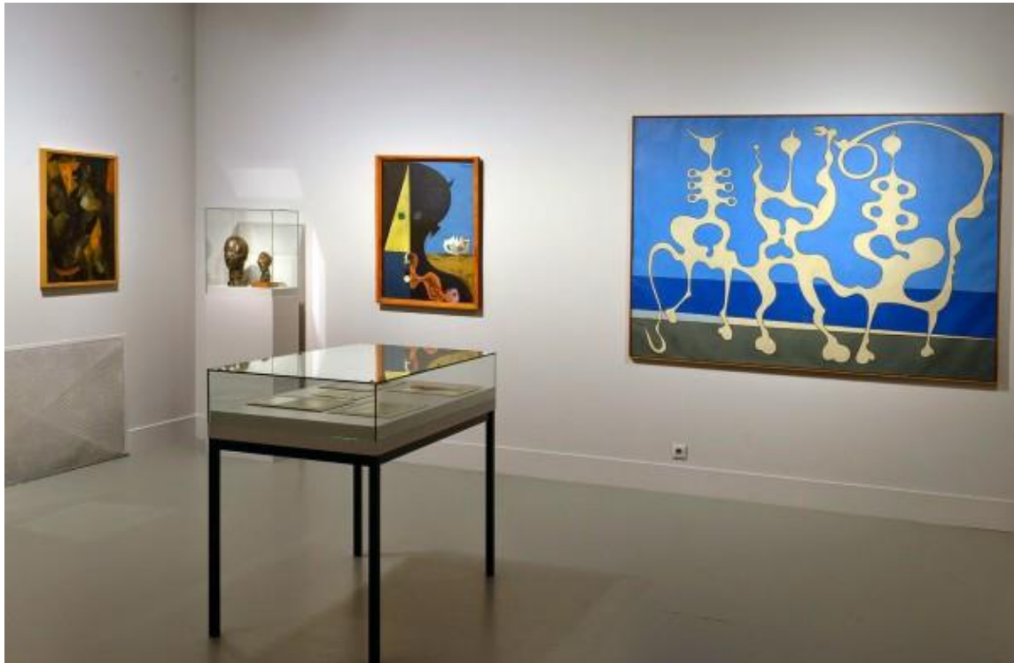
Korniss Dezső: Laokoón (Küzdés II.) 1949.