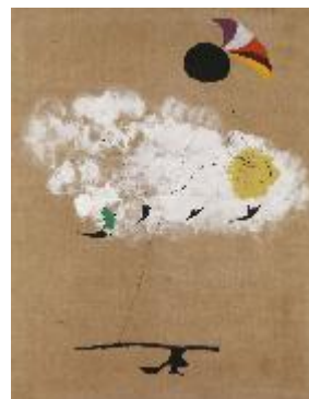
Miró: Spanyol Táncos, 1932.