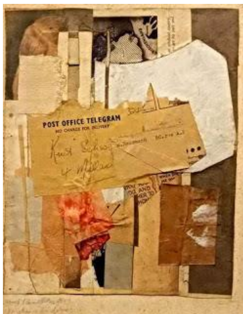
Kurt Schwitters – Kollázs