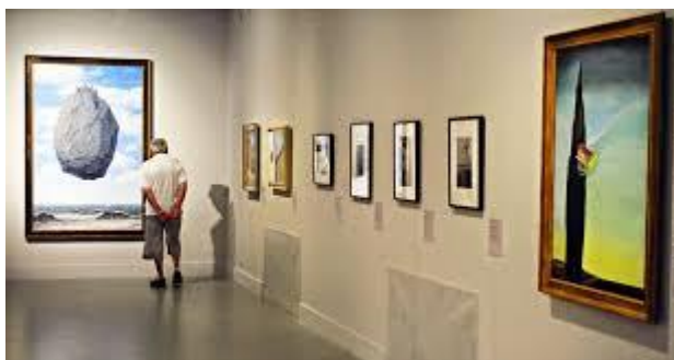
René Magritte Kastély a Pireneusokban.