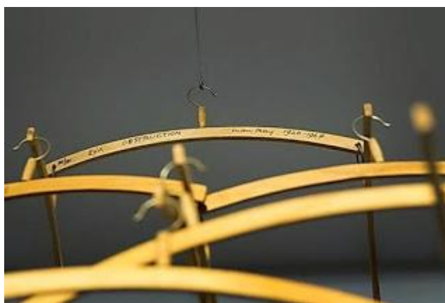
Man Ray: Akadály 1920