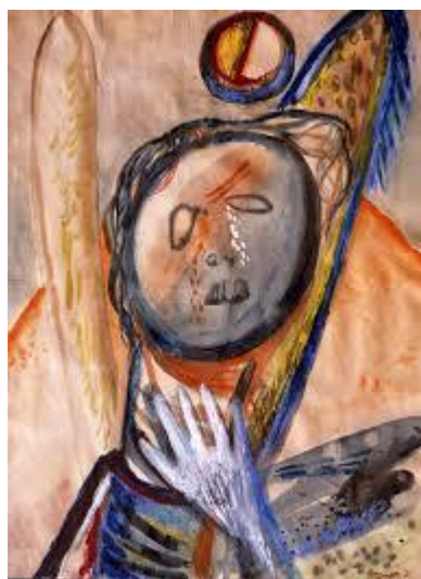
Ámos Imre: Síró angyal, 1941