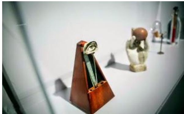
Man Ray - Metronom, 1923