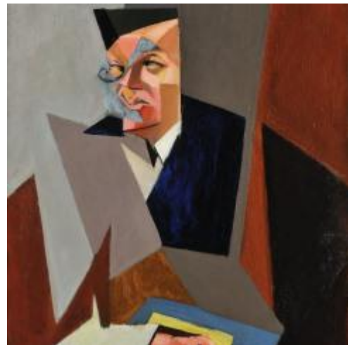
Tihanyi Lajos: Tristan Tzara