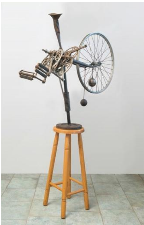
Galántai György: Tisztelet a mestereknek (Duchamp + Arman + Tinguely), 1983.

E szekció csattanója egy Galántai György mű. Az 1983-as Tisztelet a mestereknek (Duchamp-Arman-Tinguely) című talált tárgyak szürrealista kompozíciója, amelyek Lautréamont híres „esernyő-varrógépes” szürrealizmus definícióját szabadon értelmezve, nem a boncaszalon, hanem Duchamp Biciklikerekéhez hasonló hokedlin egyesülnek. A kiállítás itt tér vissza a kezdeteihez, az első szekció, a Meglepő társítások: kollázs, asszamlázs, objekt alkotásaihoz.