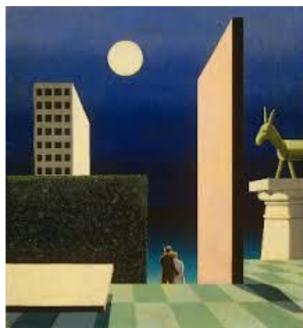
Bortnyik Sándor Zöld szamar 1924.