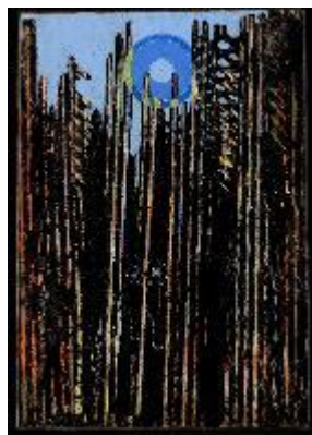
Max Ernst: Erdő