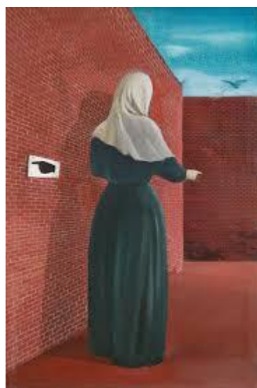
Nő fal előtt 1955.