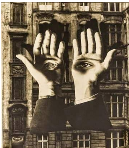
Herbert Bayer - Magányos nagyvárosi, 1932 fotómontázs