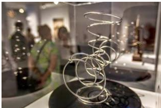
Man Ray Tavasz 1958