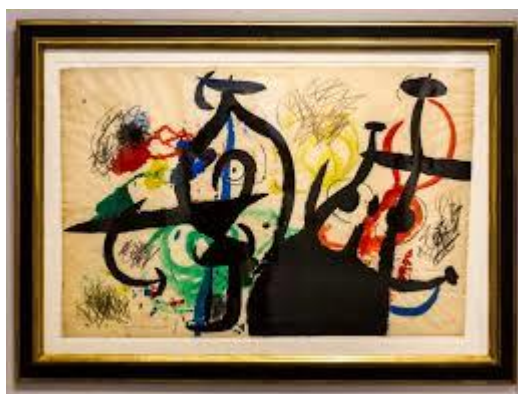
Miró – Nő és madarak