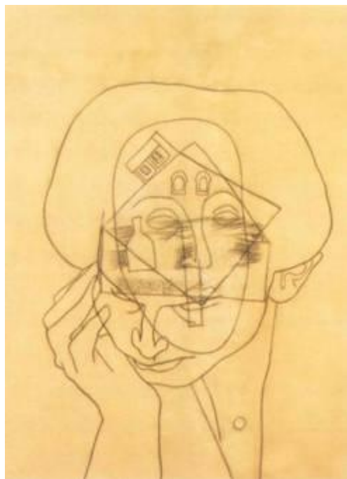
Vajda Lajos. Kettős portré házzal, 1937

A második egység a Mélyvilágok címet viseli, és az Európai Iskola művészeinél megjelenő szürrealista tendenciákat mutatja be. Vajda Lajos , Ámos Imre , Farkas István , Martinszky János alkotásait vezetik be a magyar festészet e korszakának a bemutatását, majd Bálint Endre , Vajda Júlia , Jakovits József , Korniss Dezső , Anna Margit , Rozsda Endre , Gyarmathy Tihamér , Lossonczy Tamás munkáinak sora következik.