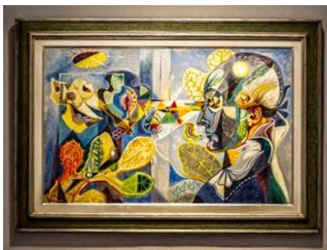
André Masson - Goethe és a növények metamorfózisa, 1940