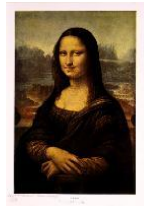
Marcel Duchamp: L.H.O.O.Q., 1919