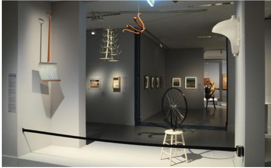
Marcel Duchamp ready-made-jei

A második egység az Automatizmus, biomorfizmus és metamorfózis , a harmadik az Illúzió és az álomtáj , a negyedik pedig A vágy (múza és áldozat) . Ezek a termek a szurrelizmus különböző arcait, alkotóit mutatják be.