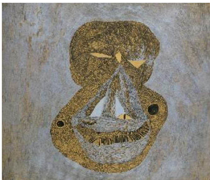
Vajda Lajos : Ezüstgnóm 1940.